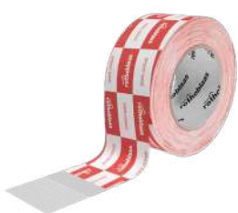
SPEEDY BAND pág. 76