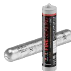
FIRE SEALING pág. 130-132