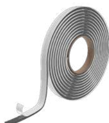
SUPRA BAND pág. 140